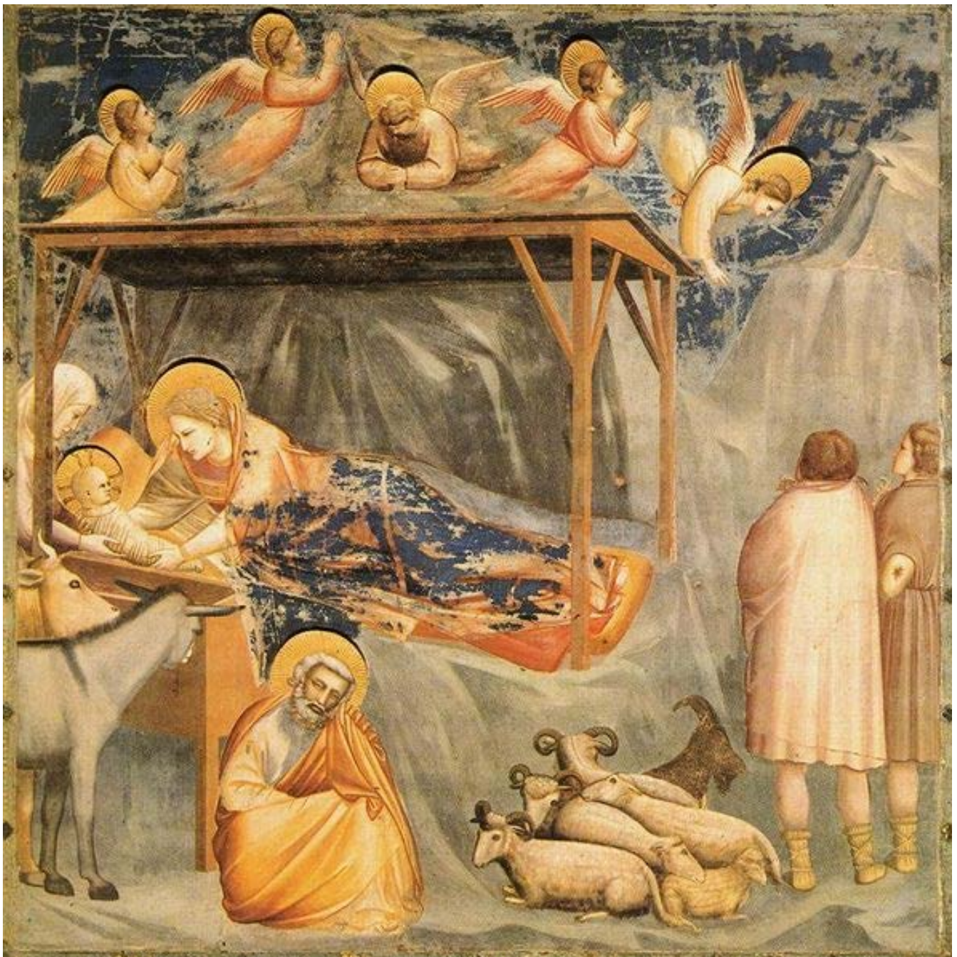
Giotto di Bondone (1267-1337), Chapelle Scrovegni, Padoue, La Nativité.